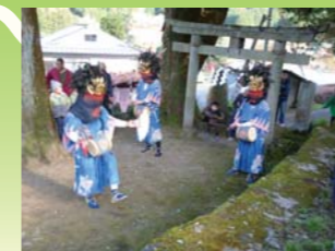
獅子舞奉納(姫宮神社)