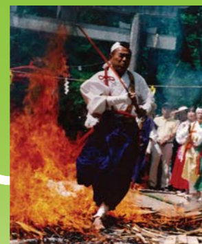
金剛山瑞峯寺(火渡り)