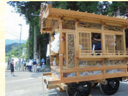
彫刻屋台(八坂神社)